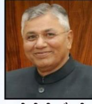
श्री पी.पी. चौधरी माननीय सांसद एवं विधी एवं न्याय, सूचना एवं प्रौद्योगिकी राज्यमंत्री, भारत सरकार