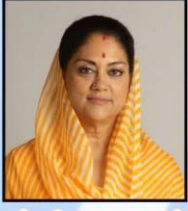
श्रीमती वसुन्धरा राजे माननीय मुख्यमंत्री राजस्थान सरकार